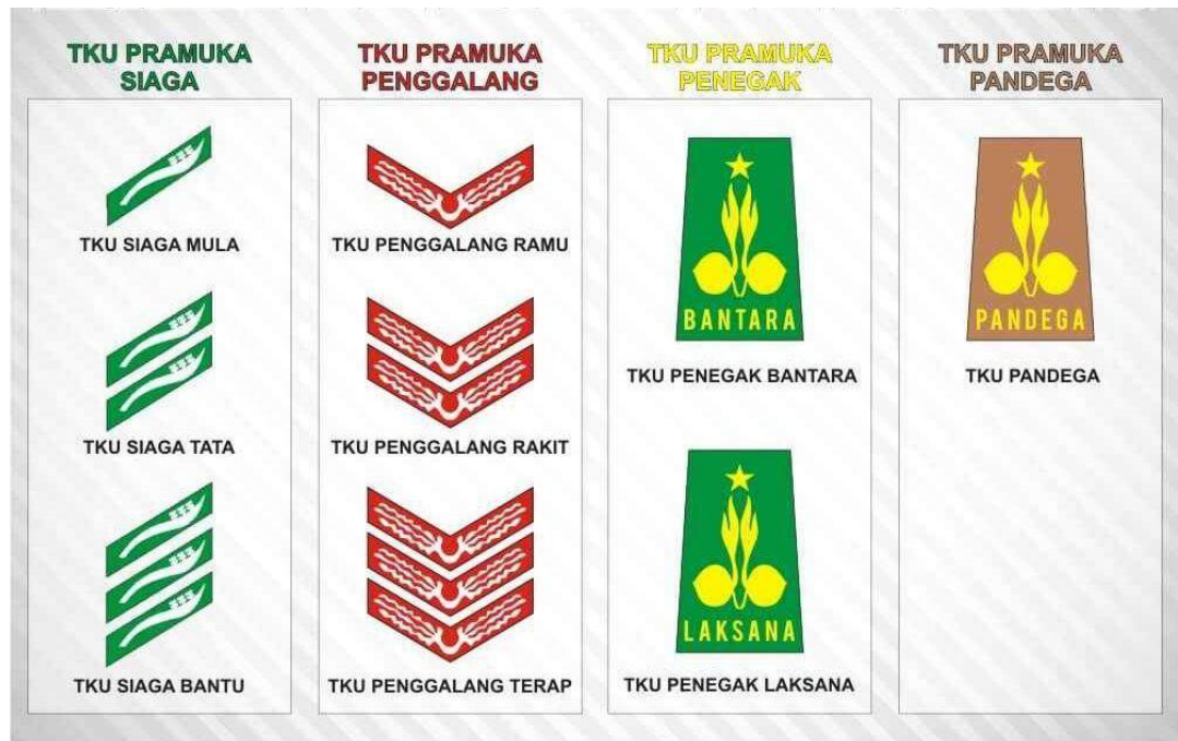
Gambar 1. Lambang pada Tingkatan Pramuka

Sebutan pandega memiliki arti pemuka atau ahli. Selain itu, sebutan pandega juga diambil dari masa 'memandegani' atau masa setelah Indonesia berhasil meraih kemerdekaan dan menjadi negara berdaulat.